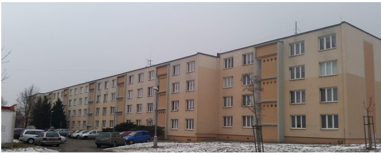
Foto domu západní strana