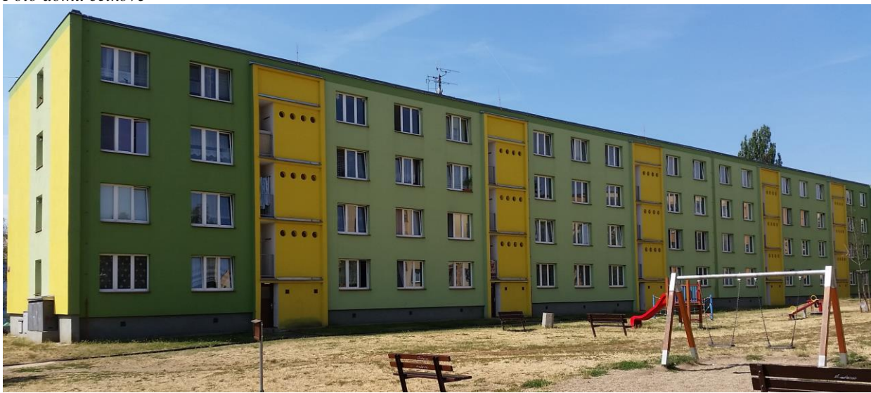
Foto domu celkově